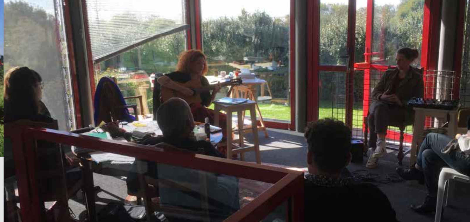
L'Acantah - Premier public

Rencontre conviviale et informelle, gratuite et ouverte à tous, sans inscription mais dans le respect des consignes sanitaires en vigueur.