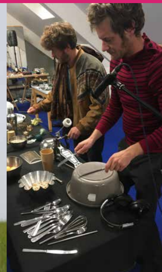
Datakidz Recherche sonore