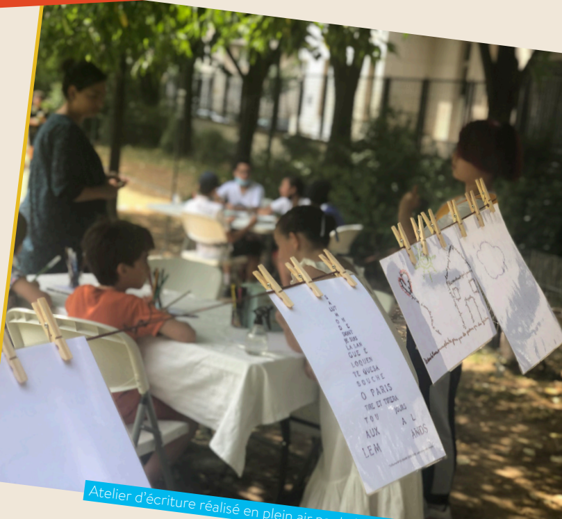
Atelier d'écriture réalisé en plein air par le Labo des Histoires Normandie