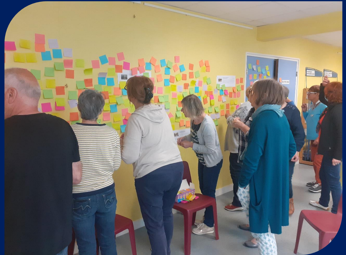
Biblioremix à Saint-Vaast-La-Hougue - BDM