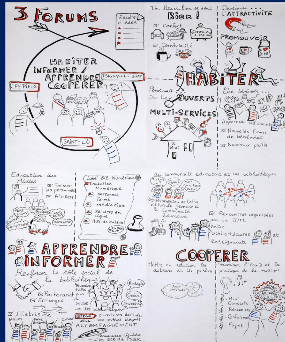
Restitution des forums ouverts- septembre 2019